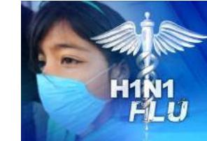
H1N1 FLU सोमवारी १ हजार ७६३ रुग्णांची तपासणी करण्यात आली. त्यातील ७८ रुग्णांना टॅमी फ्लूच्या गोळ्या देण्यात आल्या. आजारातून जानेवारीपासून शहरात ८४ रुग्णांचा मृत्यू झाला. सध्या ८ रुग्णांवर जनरल वॉर्डमध्ये उपचार सुरू आहेत. गेल्या वर्षात ११ रुग्णांचा त्यामुळे मृत्यू झाला होता. शहरातील २ लाख ४६ हजार ३०१ नागरिकांची स्वाइन फ्लूची तपासणी करण्यात आली. आजपर्यंत शहरात स्वाइन फ्लू झालेल्या रुग्णांची संख्या ८०३ इतकी

पुणे : प्रतिनिधी शहरात स्वाइन फ्लूचे धैमान सुरूच असून, या आजारातून आणखी दोन रुग्णांचा बळी गेला आहे. शहरात स्वाइन फ्लूने मृत्युमुखी पडलेल्यांची संख्या आता ८४ झाली आहे. सध्या ६ रुग्ण अत्यवस्थ असून, त्यांना व्हेंटिलेटरवर ठेवण्यात आले आहे. शहरातील सध्याचे वातावरण स्वाइन फ्लू वेगाने पसरण्यास कारणीभूत ठरले आहे. सध्या महानगरपालिकेच्या व खासगी रुग्णालयांत स्वाइन फ्लूच्या रुग्णांची तपासणी करण्यात येत आहे. १ जानेवारीपासून आजपर्यंत १ लाख ५७ हजार २२९ संशयित स्वाइन फ्लूच्या रुग्णांची तपासणी करण्यात आली आहे. त्यातील १८ हजार १९ रुग्णांना टॅमी फ्लूची औषधे देण्यात आली आहेत.